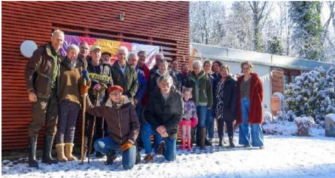
De vrijwilligers samen met medewerkers van het Hospice

't Huis van Heden meldt zich al vele jaren aan bij het Oranjefonds voor deze klussendagen, zo ook dit jaar weer. Er zijn diverse werkzaamheden te verrichten, o.a. de tuin bladvrij maken, de buitenterrassen van de gastenkamers onkruidvrij- en schoonmaken, plantenbakken verplaatsen, de voorraadkamer en het magazijn schoonmaken en opruimen en diverse goederen naar de stort en naar Het Goed brengen. Voor al deze klussen hadden zich veertien vrijwilligers aangemeld. De vrijwilligers stonden 11 maart 's morgens voor een grote verrassing, de gehele tuin was bedekt met een laag sneeuw. Er kon niet in de tuin gewerkt worden. Gelukkig konden alle andere klussen wel worden gedaan.