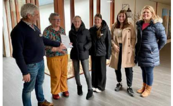
De leerlingen overhandigen een cheque van € 300,00